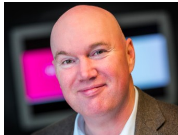
Arie van Bellen over de digitale