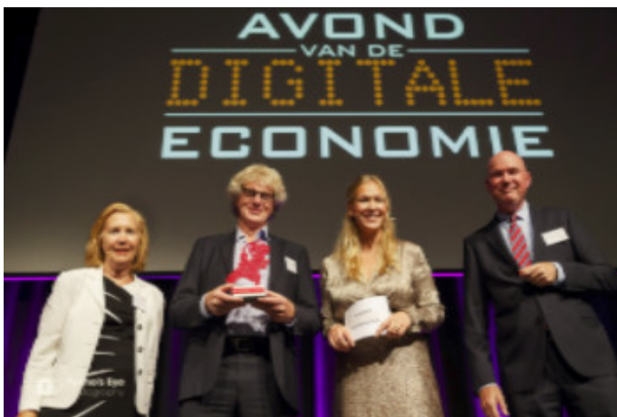
Avond van de Digitale Economie

In deze nieuwsbrief leest u wie de winnaars tijdens de Avond van de Digitale Economie waren, vatten we samen welke digitale onderwerpen op Prinsjesdag aan bod kwamen, leest u het laatste nieuws over o.a. het Jaarcongres ECP, de Codeweek, NL IGF en Geef IT Door, en blikken we vooruit op een najaar vol events en campagnes.